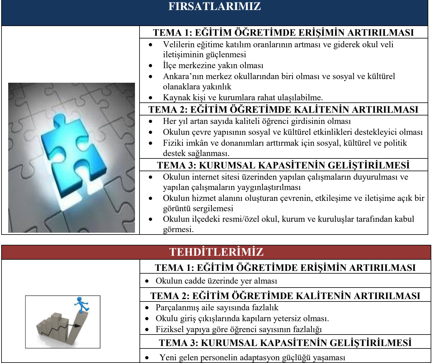
Tablo 23. GZFT Listesi